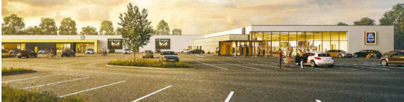
Nahversorgungszentrum Oberbruch (Beispielabbildung) – www.archlab.de

Die Arbeitsvorbereitungen wurden abgeschlossen, der Startschuss für das umfangreiche Bauprojekt ist bereits gegeben: Die Rede ist von dem großen Nahversorgungscenter, das Frauenrath BauConcept als Generalübernehmerin gegenwärtig an der Boos-Fremery-Straße im Heinsberger Stadtteil Oberbruch errichtet.